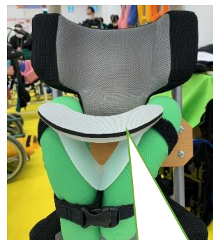
ネックサポートに付けて、顎を支える